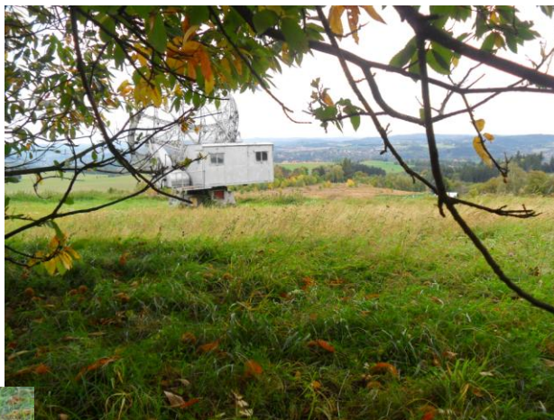
Výhled jedna radost!