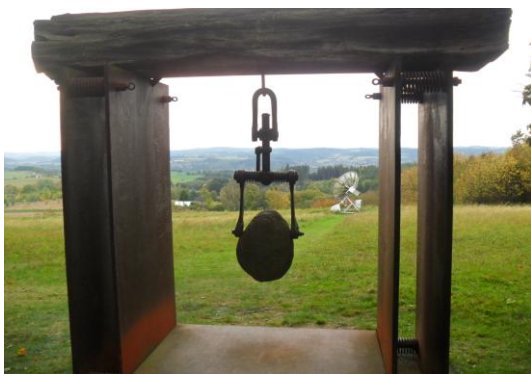
Poznávacím bodem je tento zavěšený kámen.