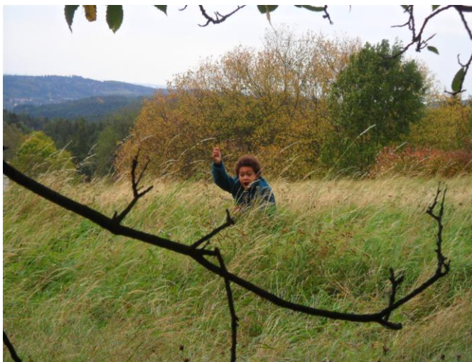
Na šachy se nějak zapomnělo... Ať žije piknik!!!!